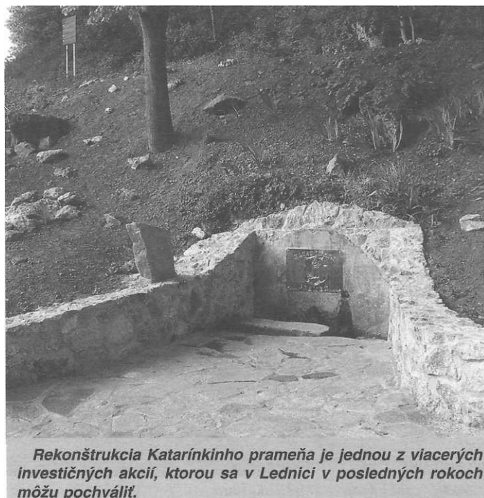
Rekonštrukcia Katarínkinho prameňa je jednou z viacerých investičných akcií, ktorou sa v Lednici v posledných rokoch môžu pochváliť.